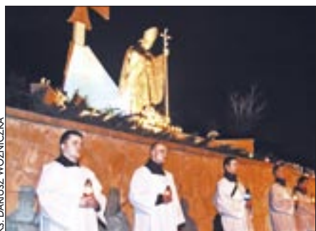
Sandomierzanie modlili się pod figurą Ojca Świętego na placu papieskim

Na placu papieskim z lampionami i zniczami odmówiono Różaniec o rychłą beatyfikację i kanonizację sługi Bożego Jana Pawła II. – Maryjo, w tej godzinie apelu, zawierzam Ci na nowo to miasto, w roku misji świętych, zawierzam Ci to miasto, które tak szczerze staje przy krzy-