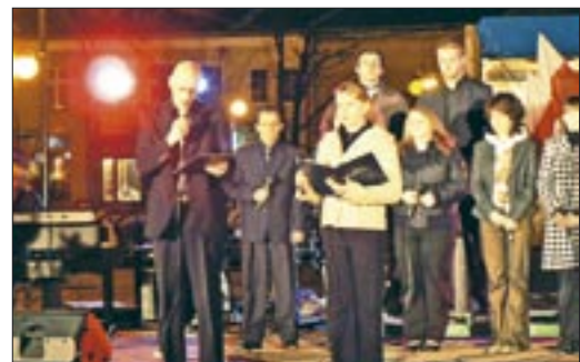
Głównym punktem obchodów była Droga Krzyżowa