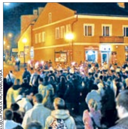
Głównym punktem obchodów była Droga Krzyżowa