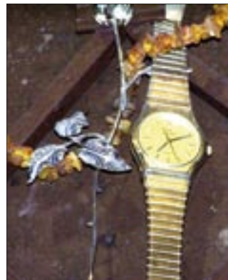
Różnego rodzaju cenne wota znajdują się przy obrazie w ołtarzu głównym sanktuarium

ukazującego rany wzniesionych dłoni, a jednocześnie i miłosiernego Zbawiciela stojącego frontalnie w sarkofagu. Maria obejmuje Chrystusa, kładąc lewą dłoń na Jego ramieniu, a więc w sposób znany już z wcześniejszych obrazów norymberskich, ale tylko na obrazie z Sulisławic dotyka prawą dłoń rany w boku – źródle Bożego miłosierdzia. Także nowy Dom Pielgrzyma w Sulisławicach, a jednocześnie dom