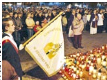
Poczet sztandarowy Gimnazjum nr 2 im. Jana Pawła II przed pomnikiem patrona szkoły

Już podczas Drogi Krzyżowej odprawionej 30 marca wzdłuż Alej Jana Pawła II w Stalowej Woli młodzież przypominała rozważania Papieża o Bogu. W dniu śmierci Ojca Świętego, 2 kwietnia, przed pomnikiem Papieża przy bazylice konkatedralnej w Stalowej Woli wierni składali kwiaty, palili znicze i modlili się o beatyfikację naszego rodaka. O godzinie 18.30 rozpoczęła się Msza św. w intencji Papieża zamówiona przez społeczność Gimnazjum nr 2 im. Jana Pawła II. O godz. 20.15 przy pomniku Ojca Świętego odbyło się muzyczne misterium „Modlitwa i pamięć – w hołdzie Janowi Pawłowi II” w wykonaniu młodzieży. Na telebimie rozpiętym nad wejściem do bazyliki oglądać można było fragmenty filmów dokumentalnych o papieżu. Przed pomnikiem płonęły setki zniczy. O godz. 21 odprawiony został Apel Jasnogórski i modlitwa różańcowa. W godzinę śmierci Jana Pawła II, o 21.37, rozdzwoniły się dzwony w kościołach. A potem jeszcze czytano fragmenty papieskiego nauczania.